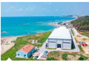
Karataş Atık Su Arıtma Tesisi, ilçenin doğusunda denize yakın alanda inşa edildi.