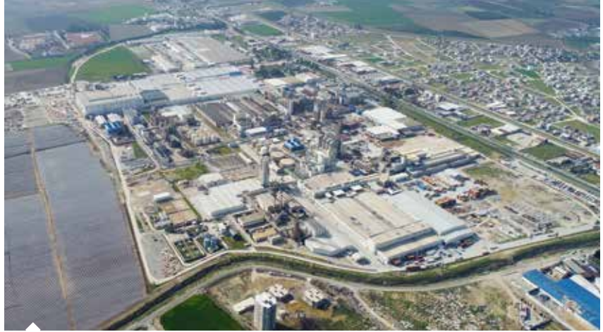
SASA'nın Adana-Mersin karayolu üzerindeki tesislerinde devam eden ilave yatırımlarla elyaf, pet cips ve PTA üretiminde yıllık 1,6 milyonluk kapasite artışı sağlanması hedefleniyor.

Sasa'nın mevcut tesislerinde elyaf, poy, cips ve saflaştırılmış tereftalik asit (PTA) üretimi gerçekleştirdiklerini ifade eden Şeker, Yumurtalık'ta daha büyük ve kapsamlı yatırımlar olacağını vurgulayarak şunları söyledi: "İlk etapta 'PTA'yı 650 mil-