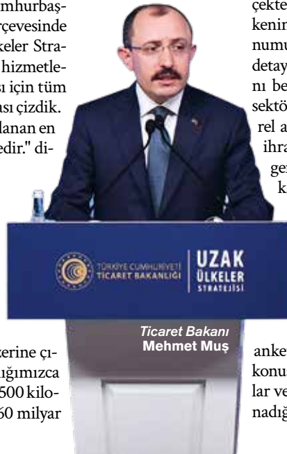
Ticaret Bakanı Mehmet Muş

Bakan Muş, oluşturdukları strateji ile ihracatı artırma hedeflerinin yanı sıra Türk ürün ve hizmetlerinin küresel ölçekte tanınırlığının geliştirilmesine, ülkenin küresel değer zincirlerindeki konumunun güçlendirilmesine yönelik çok detaylı şekilde 328 eylem planladıklarını belirtti. Muş, hizmet ihracatından alt sektörlere kadar inerek ayrıntılı sektörel analizler yaptıklarını, mal ve hizmet ihracatçısı firmalarla anket çalışmaları gerçekleştirdiklerini aktararak, ankete katılan firmaların profillerini çıkarttıklarını, ihracatçıların söz konusu pazarlarda karşılaştıkları pazara giriş engellerini, kısıtlarını veya pazara girişlerini kolaylaştıran etkenleri tespit ettiklerini, yararlandıkları ihracat desteklerinin etkinliğini ölçtüklerini; anket çalışmasının, uzak ülkelere ihracat konusundaki güçlü ve zayıf yanları, fırsatlar ve tehditleri belirlemekte etkin rol oynadığını söyledi.